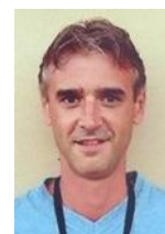
COLOMBO Fulvio Sito Internet